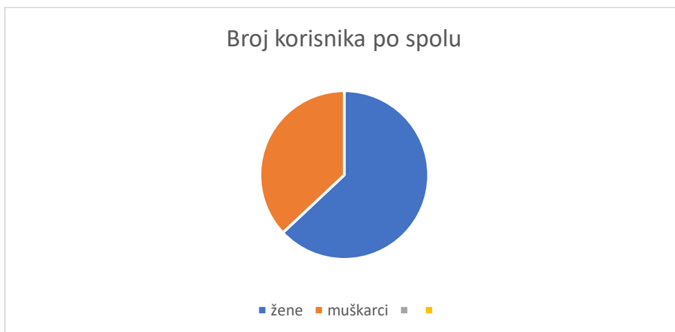
Graf 1. Prikazuje kao je u izvještajnom razdoblju od ukupnog broja korisnika 63% njih ženskog (150), a 37% muškog (87) spola.

Standardi navode kako pravo korištenja usluga narodne knjižnice imaju svi stalni i privremeni stanovnici područja pod istim uvjetima, a preporučuje se najmanje 18% učlanjenih korisnika od ukupnog broja stanovnika područja na kojem knjižnica djeluje. Prema popisu stanovnika iz 2021. godine, Općina Kolan broji 815 stanovnika. U prošloj godini Knjižnica je imala 237 učlanjena korisnika, što iznosi 29,8% od ukupnog broja stanovnika na području Općine Kolan. Broj aktivnih posuđivača s registriranom posudbom u prošloj godini je 171, što iznosi 72,15 % aktivnih članova od ukupnog broja upisanih članova.